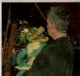
L'ensemble des spectateurs a participé activement au spectacle. Et l'arrivée de Crocodron a émerveillé les plus petits.