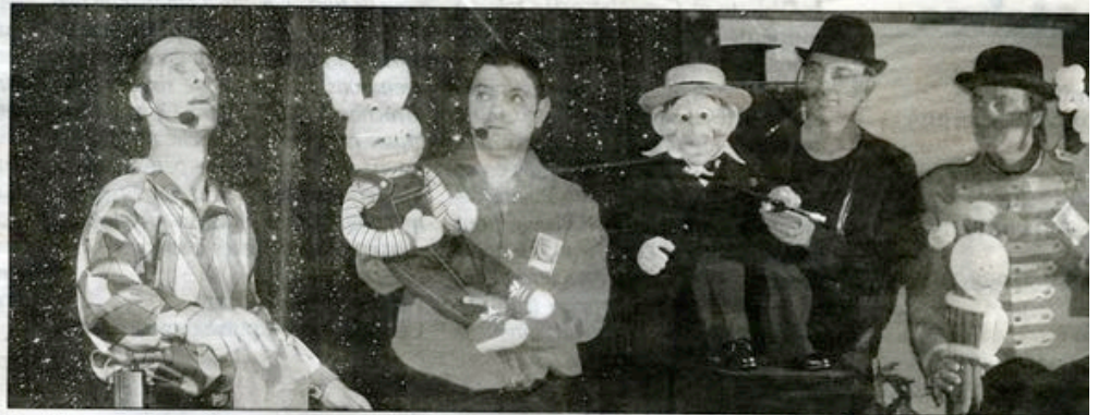
Les élèves de Marcel-Pagnol ont assisté, hier, au spectacle d'Arlequin et ses acolytes.

Aujourd'hui ce sont les élèves de la maternelle Anatole-France et les CE1 et CE2 de Marcel-Pagnol