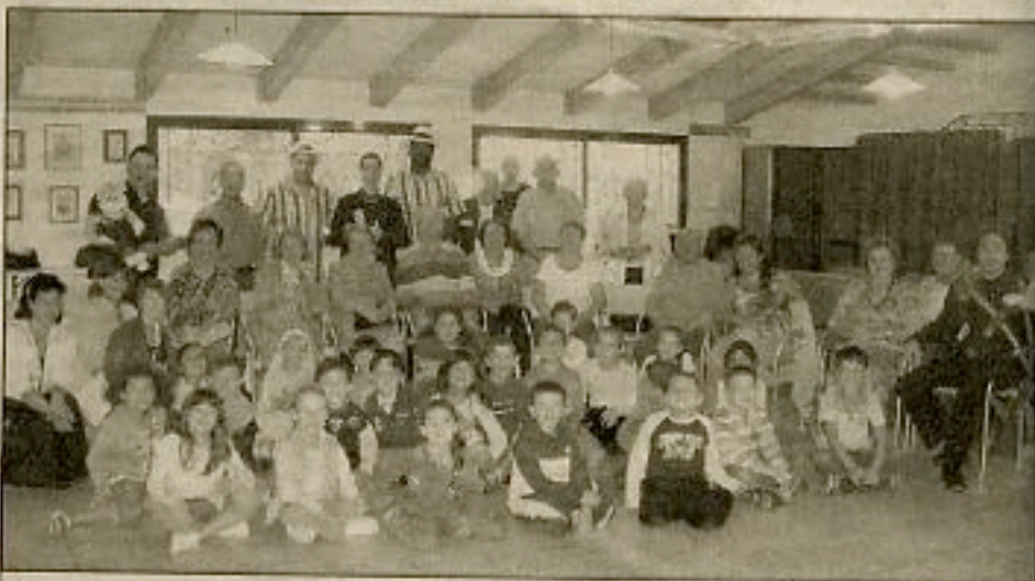
Les seniors et les enfants étaient réunis vendredi dernier, pour une rencontre « magique » salle du Lavoir.