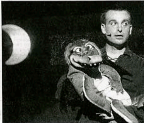
Un spectacle interactif qui a enchanté les tout petits.