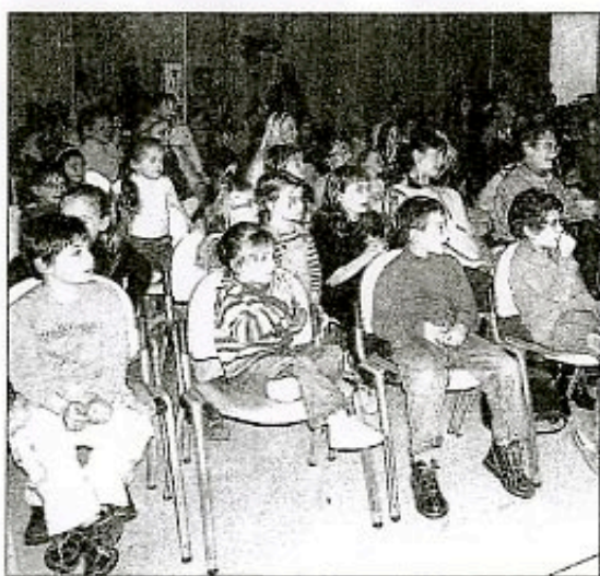
la foule des jours de fête

En équipe logistique avec « Les compagnons de l'Art