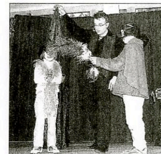
pour le très beau spectacle d'Antonin.

personnages qui ont fait hurler de rire son jeune auditoire. Ebahi aussi de voir la transformation d'un chapeau d'Halloween en professeur Rorboise ou à partir d'une