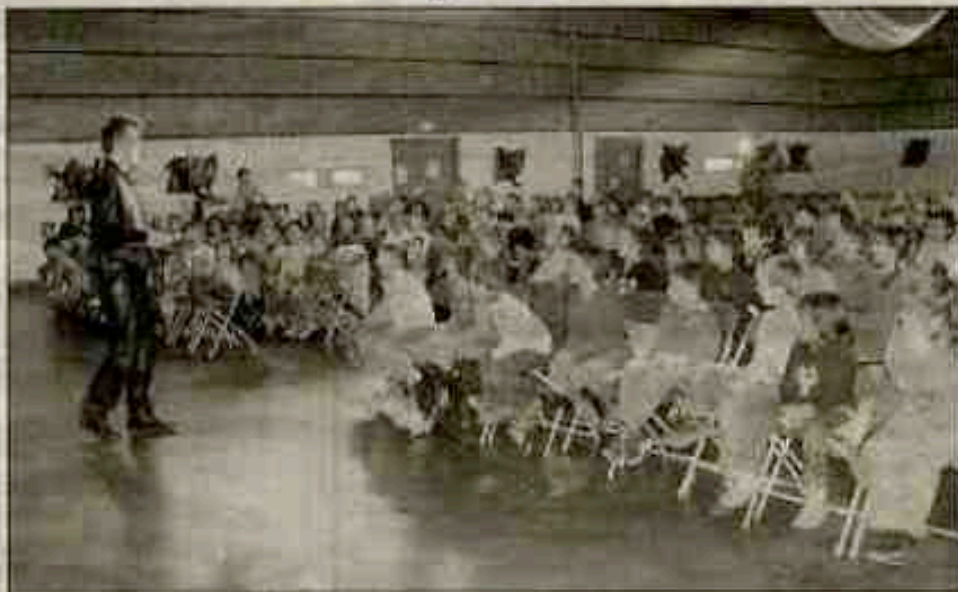
Les enfants ont apprécié le spectacle.

Des yeux émerveillés, des interrogations dans des cris de joie... les enfants de l'école primaire Jean Moulin ont été entraînés, ce dernier vendredi, dans le monde imaginaire d'Antonin. Un spectacle offert par la Caisse des écoles dans la salle polyvalente de Bormisport. Ce magicien Borméen dont la renommée a largement dépassé les frontières Varoises pour se produire dans de nombreux spectacles de France et au-delà est un artiste complet. D'une légende de la garganouille, émerge de son chapeau magique une agréable recette composée d'une once de mystère, d'un brin de ventriloquie, d'un zeste de frisson, d'une