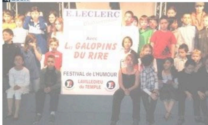
Le groupe des participants.