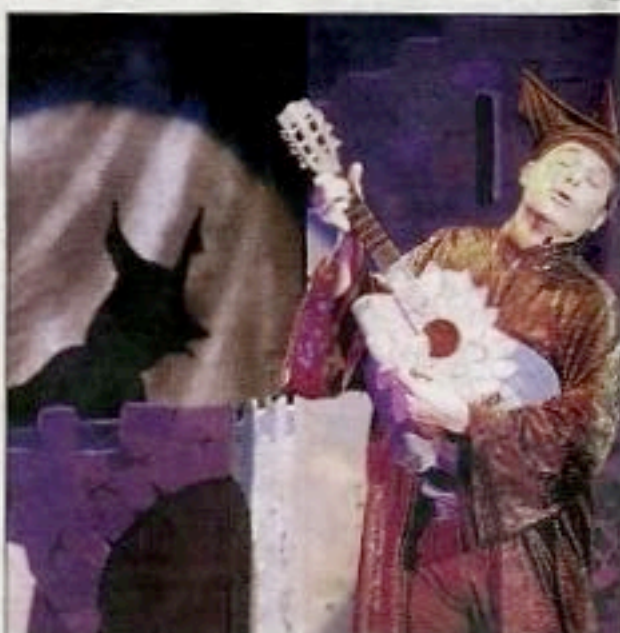
Spectacle de ventriloque pour petits et grands dimanche au Magic Mirros.