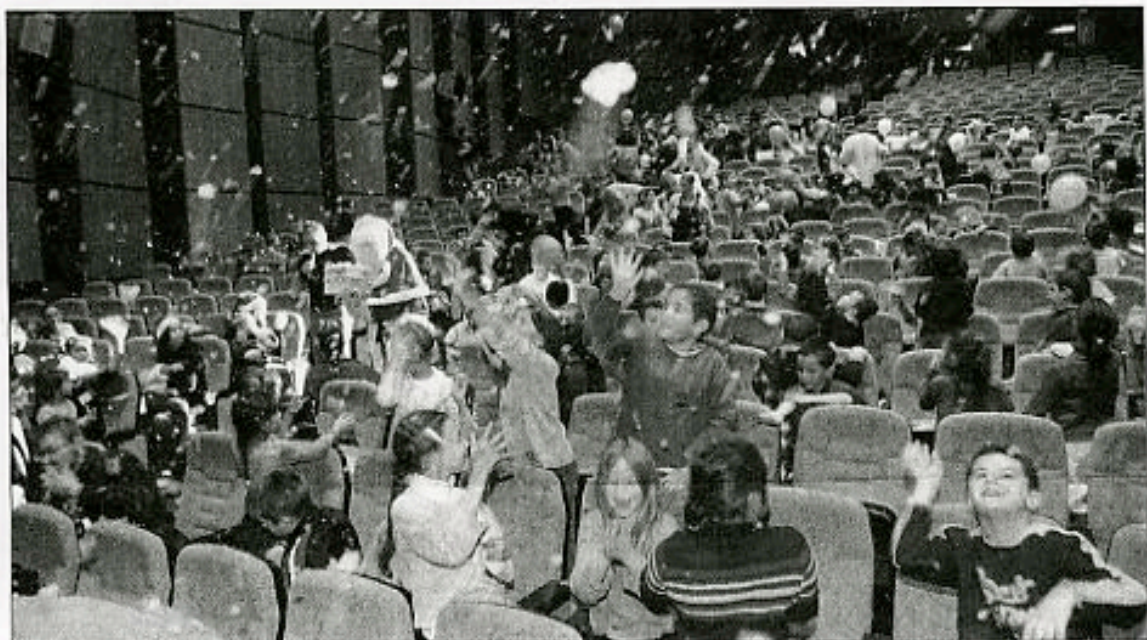
Après le spectacle de la légende de la Garganouille, le Père Noël est descendu, sous une pluie de ballons colorés et de neige blanche.

Les centres de loisirs de la commune avaient rendez-vous hier au Palais Neptune pour assister à un spectacle magique et interactif. Avec la présence exclusive du bonhomme rouge !