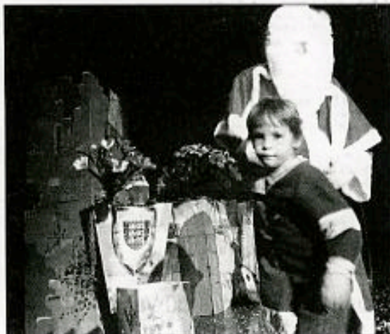
Les enfants ont pu monter sur scène pour embrasser le Père Noël.