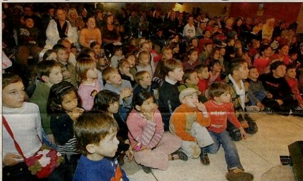
Les enfants des boulangers-pâtisseries varois ont apprécié le spectacle et les cadeaux.