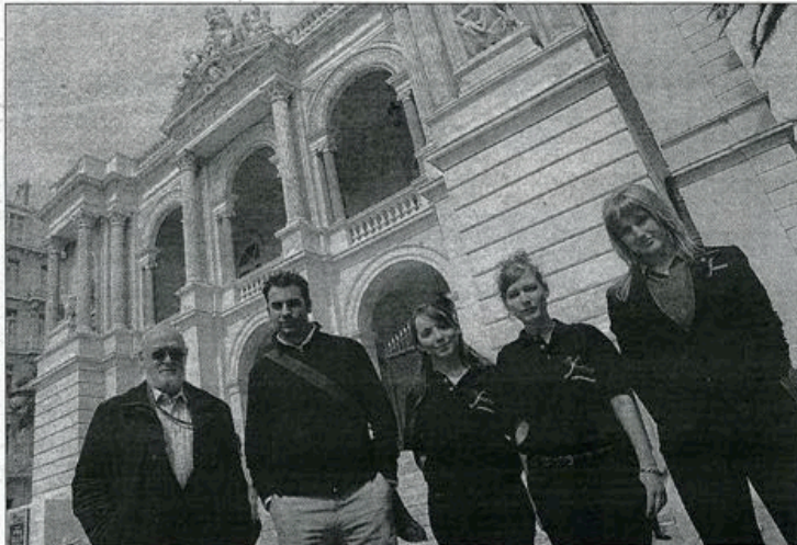
Avec le soutien des étudiants BTS du lycée Saint-Louis, le patrimoine artistique de Toulon a été mis en valeur à l'occasion de visites proposées par l'office de tourisme.

La première, mercredi après-midi, s'est concrétisée par une visite privée de l'opéra, suivie d'anecdotes sur les artistes toulonnais. La deuxième a privilégié un parcours à travers les rues de Toulon (jeudi après-midi). Dans ces projets, les trois jeunes